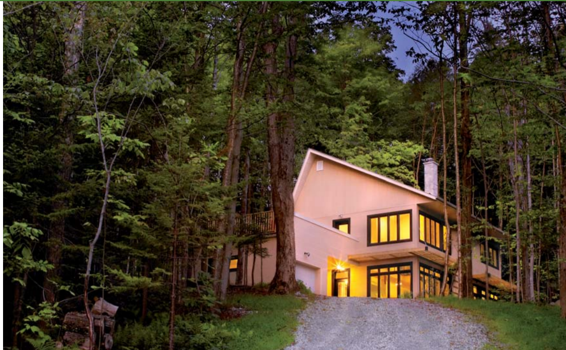
Maison Orfie du Vertendre : la première maison LEED-CANADA de niveau platine.