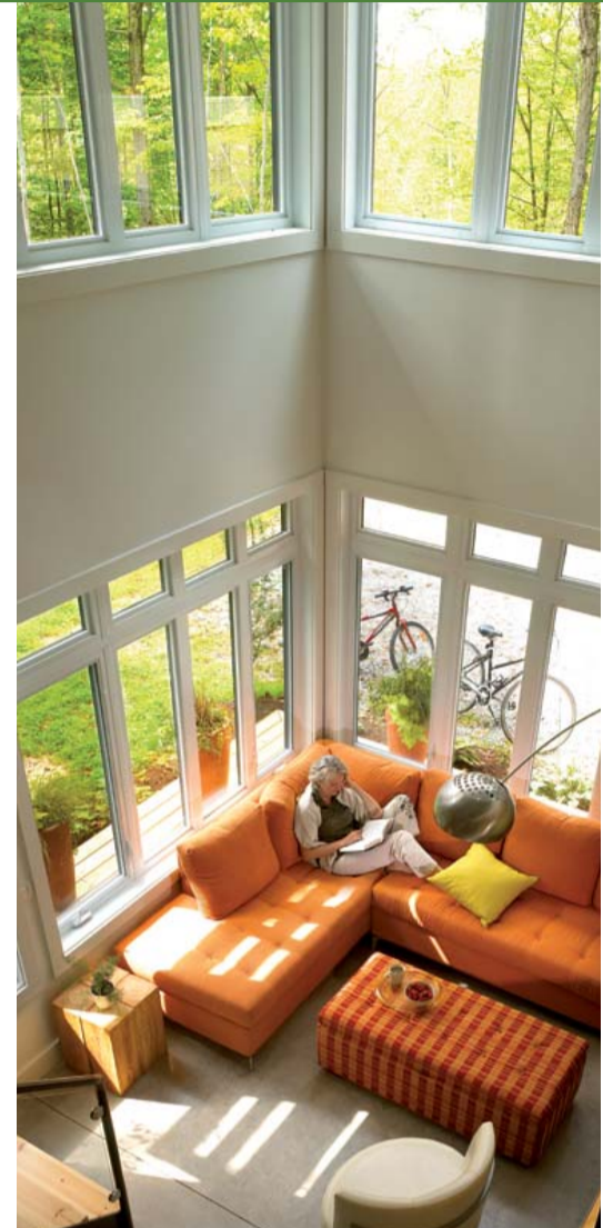
Qualité de vie incomparable

- J'en suis convaincu. Ce petit lien créera un effet domino très positif. Des retombées économiques importantes, une nouvelle clientèle pour le centre de ski donc possibilité de rentabilité, des investissements dans les infrastructures de la station grâce aux redevances générées par la construction de résidences hors Parc. Bref, une nouvelle économie verte qui se déploie et qui s'autofinance.