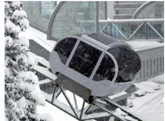
Monorail électrique projeté