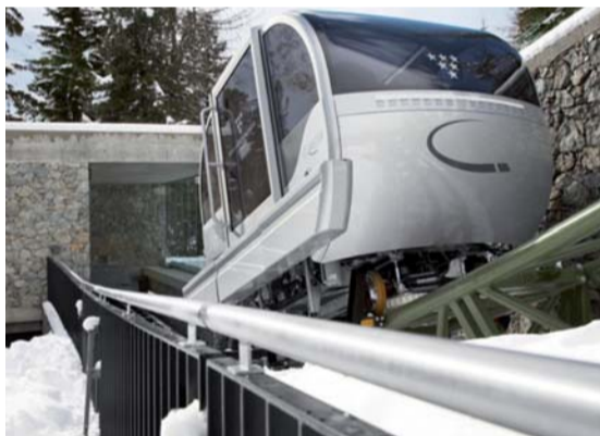
Monorail électrique projeté